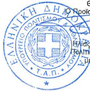
Ηλίας Πατσαρούχας Πολιτικός Μηχανικός με Β' Βαθμό

Αθήνα, 26/6/2014 Θεωρήθηκε Ο Προϊστάμενος της Δ.Υ.