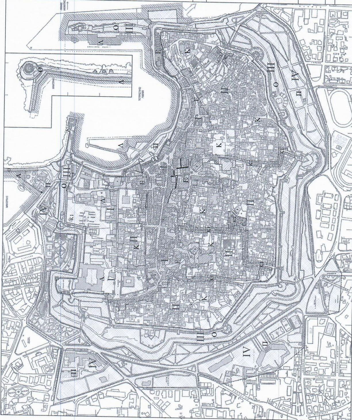
Πινάκίδα 18 A-6.2 ΤΟΜΕΙΣ ΟΡΩΝ ΔΟΜΗΣΗΣ